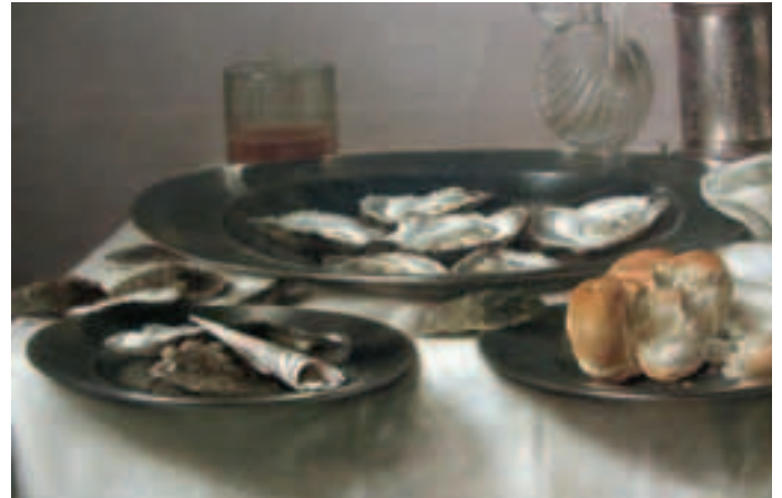
Willem Claesz. Heda (1593-1680) - Détail de la nature morte avec gobelet doré - Rijksmuseum Amsterdam Source sur Plurielles.fr : Repas de Noël : tour du monde des plats les plus traditionnels

Et en France! Les huîtres, les boudins, le foie gras, les chapons et autres volailles précèdent la bûche de Noël!